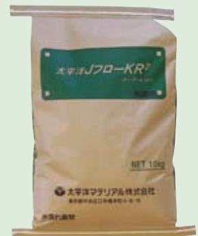
荷姿 10 kg/袋

※材料温度、外気温、水温、練混ぜ条件等により、所要の流動性を得るための練混ぜ水量が変わる場合があります。