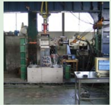
正負交番載荷試験

鋼板巻立て供試体の正負交番載荷試験において、高い靱性により耐震効果を有することが確認されています。